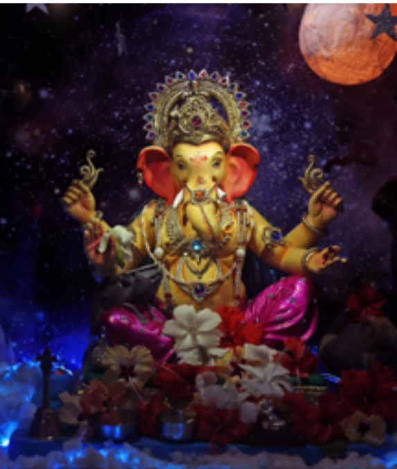
मुरुडमधील सुधीर पाटील यांच्या निवासस्थानी साकारलेली लोभस गणेशमुर्ती.