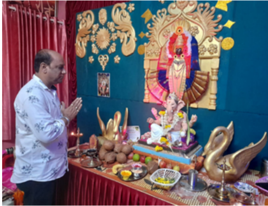
ज्येष्ठ छायाचित्रकार शेखर भोपी यांच्या निवासस्थानी गणेशाची सुंदर आरास