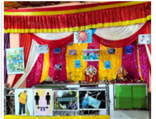
विक्रात युवक मंडळ इंदिरा गांधी नगर माथेरान ३८ व्या वर्षात पदार्पण करत यांनी कोरोना संदर्भात उत्कृष्ट सजावट साकारली होती. (छाया : मुकूंद रांजाणे, माथेरान)