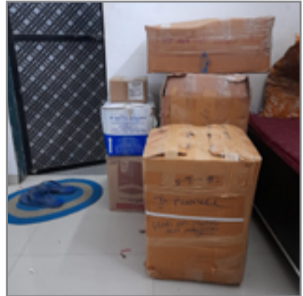
घेतले आहे व त्यांच्याकडून ३ लाख ४४ हजार ४५० रुपये किंमतीचे अॅपल कंपनीचे मोबाईल कव्हर, अॅपल कंपनीचे एअर पॉड, युएसबी केबल, मेघासेफ चार्जर, एअरपॉट केस इत्यादी ऐवज ताब्यात घेवून त्यांच्या विरोधात कॉपीराईट अॅक्ट १९५७ कलम ५१, ६३ प्रमाणे कारवाई केली आहे.