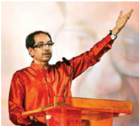
जोरदार तयारी व बैठकांचे सत्र सुरु झालेय.

दै.रायगड नगरी । मुंबई आगामी पालिका निवडणुकीच्या तयारी साठी शिवसेना सज्ज झाली आहे. येत्या दि.२१ सप्टेंबर रोजी गौरेगाव पूर्व येथील नेस्को संकुलात शिवसे-नेचा मेळावा होणार आहे. शिवसेना पक्षप्रमुख उद्भव ठाकरे यांचे प्रमुख मार्गदर्शन यावेळी होणार आहे. सुमारे ३५००० जण भावतील असा मोठा हॉल या मेळाव्यासाठी बुक करण्यात आला आहे.