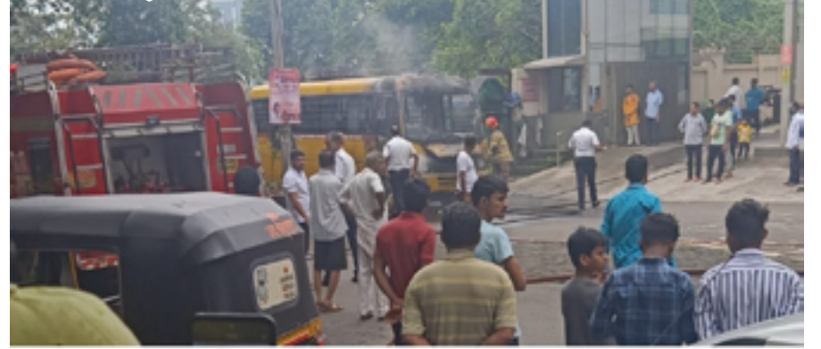
दै.रायगड नगरी । पनवेल

खारघर येथे एका स्कूल बसला भीषण आग लागल्याची घटना सोमवारी दुपारी १२ वाजण्याच्या सुमारास घडली आहे. परंतु सुदैवाने वाहकाच्या सतर्कतेमुळे त्याने गाडीतील तिन्ही विद्यार्थ्यांना प्रसंगावधान राखीत बस मधून खाली उतरवल्याने पुढील दुर्घटना टळली आहे.