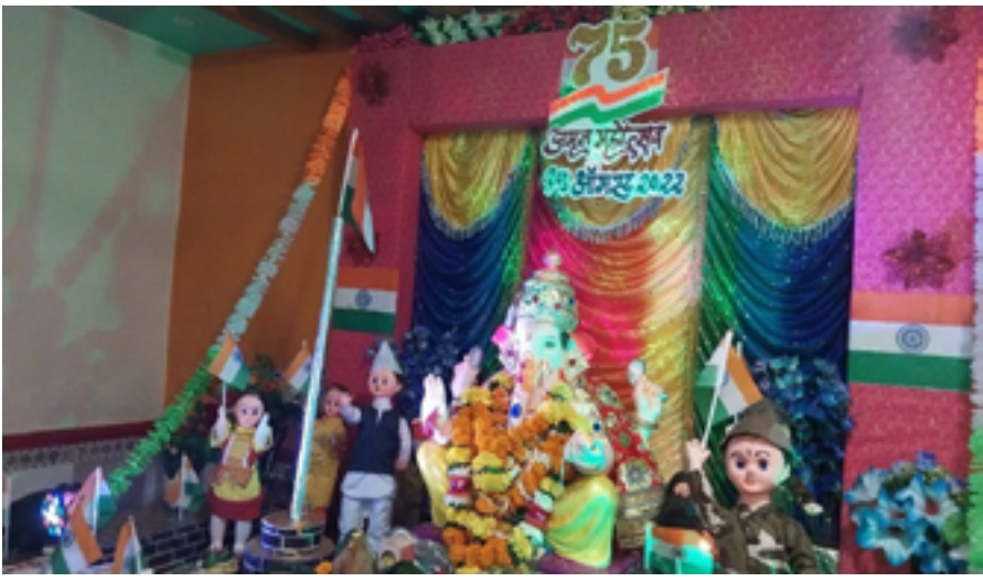
दिघोडे येथील डी. डी. कोळी यांच्या घरातील सुबक गणेश मूर्ती व भारताच्या अमृत महोत्सवी वर्षा निमित्त केलेला देखावा