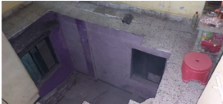
गाव नवीन पनवेल शहराला लागून आहे. त्यामुळे हजारो नागरिक या

दै.रायगड नगरी । पनवेल सुकापुर येथील ज्योती सोसायटीच्या दुसऱ्या मजल्याचा स्लॅब १० ऑक्टोबर रोजी रात्रीच्या सुमारास कोसळला. सुदैवाने यात कोणतीही जीवितहानी झाली नाही. पुनर्विकास रखडल्यामुळे अनेक इमारती जीर्ण झाल्या आहेत. त्यामुळे नैनाने ताबडतोब पुनर्विकास करण्यासाठी परवानगी द्यावी अशी मागणी करण्यात येत आहे. पनवेल तालुक्यातील सुकापुर हे