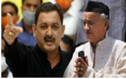
आम्ही हे आंदोलन सुरुच ठेवू. भगतसिंह कोश्यारी यांच्या राज्यपालपदावरून हकालपट्टी होत नाही, तोपर्यंत आम्ही शांत बसणार नाही, असा थेट इशारा संभाजीराजेंनी दिला आहे.

दरम्यान, राज्यपाल वेळोवेळी अपशब्द काढतात. यावर भाजपचे सरकार कशे शांत राहू शकते. कोश्यारी यांना महाराष्ट्रातून काढल्यानंतरच भाजपचे छत्रपती शिवाजी महाराज यांच्यावरील प्रेम निश्चित होणार आहे. राज्यपालांविषयी उदयनराजे भोसले यांनी घेतलेली भूमिका योग्य आहे. उदयनराजे आणि संभाजीराजे वेगळे नाहीत. आम्ही आंदोलन वेगळ्या पद्धतीने करत आहोत. मात्र आम्ही दोघे एकच आहोत, असे संभाजीराजे म्हणाले.