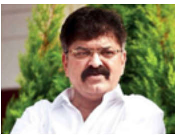
कार्यकर्त्यांनी त्या दर्शकाला मारहाण केली होती. यानंतर मंगळवारी ठाण्यातील वर्तकनगर पोलीस ठाण्यात जितेंद्र आव्हाडांसह १०० कार्यकर्त्यांवर गुन्हा दाखल करण्यात आला होता.

हर हर महादेव या मराठी चित्रपटात छत्रपती शिवाजी महाराजांबद्दल चुकीची माहिती दाखवली आहे, असा आरोप करत राष्ट्रवादी काँग्रेसचे आमदार जितेंद्र आव्हाड यांनी सोमवारी काही कार्यकर्त्यांना सोबत घेऊन रात्री दहा वाजण्याच्या सुमारास विविधाना मॉल येथील शो बंद पडला होता. यावेळी चित्रपट पाहण्यासाठी आलेल्या एका दर्शकाने चित्रपटाचे पैसे परत मागितले, तसेच कोण जितेंद्र आव्हाड असा सवाल केल्याने, संतप्त झालेल्या राष्ट्रवादीच्या