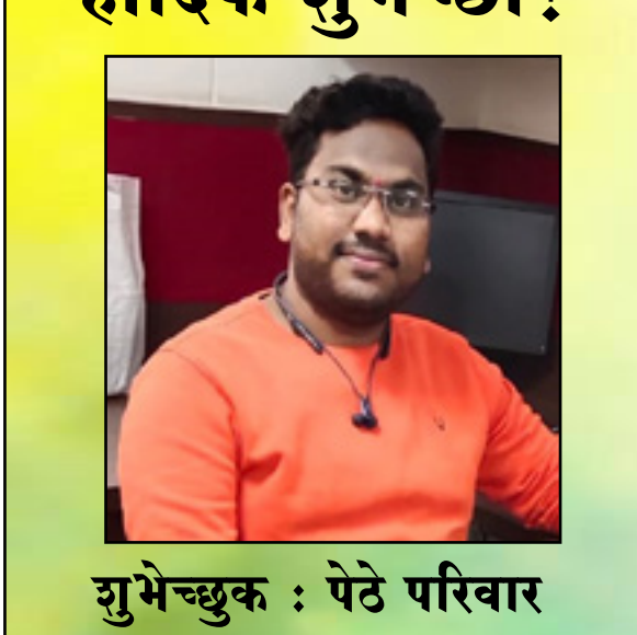
शुभेच्छुक : पेठे परिवार